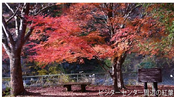
ビジターセンター周辺の紅葉

気を付けなくてはいけないこともあります。気持ちよく登山できるシーズンです。しっかり準備して楽しい登山を楽しんでください。(管)