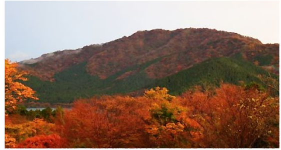
ビジターセンターからの眺め

登山道が安全に復旧し、皆様をお迎えできる日を楽しみにしています。ビジターセンター周辺は紅葉も始まり、安心して散策して頂けます。(志岐)