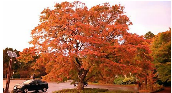
ビジターセンター前のイロハモミジ